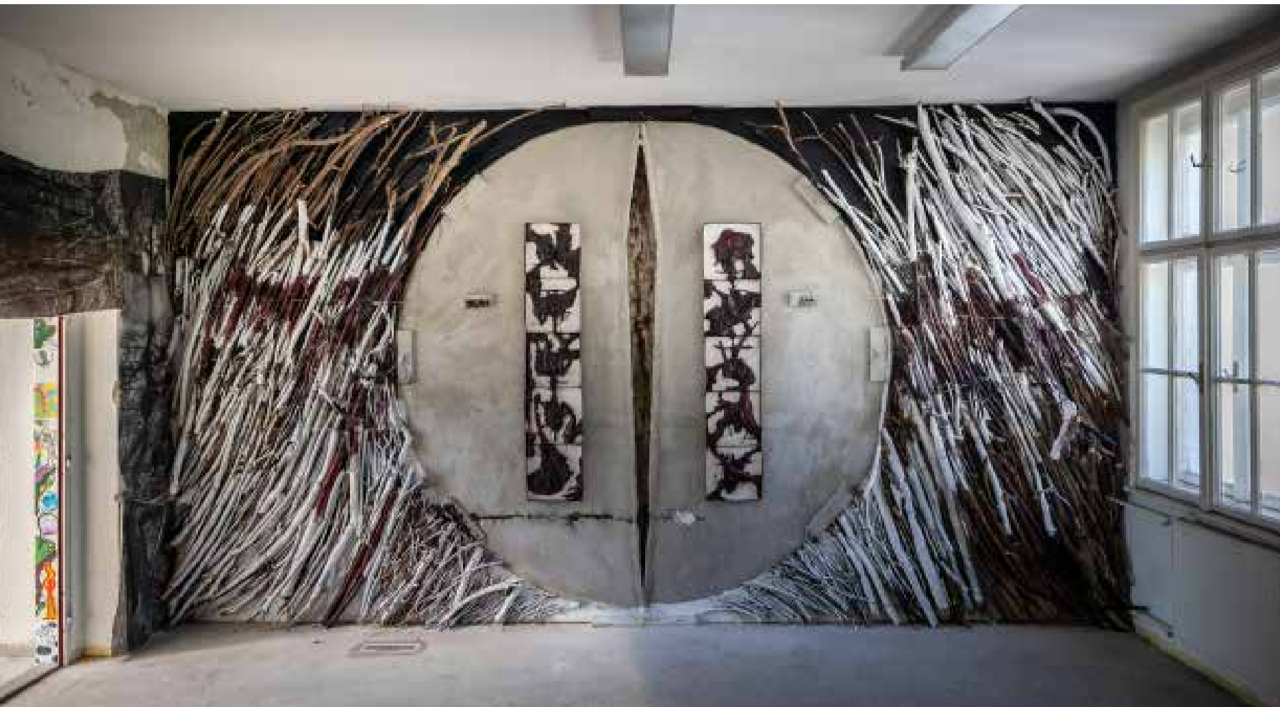
Richard Hronský: Východisko 2 , 2023.