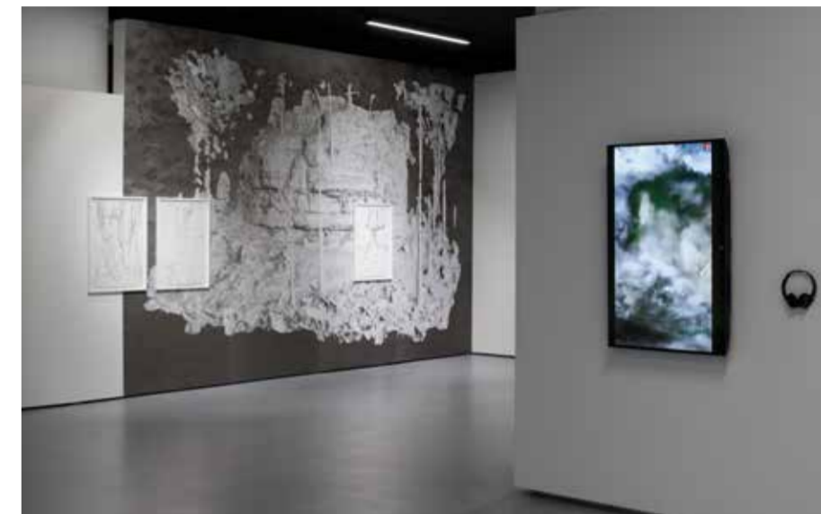
Pohľad do výstavy, zľava doprava: Pétursson Finnbogí: Republic Frequencies , 2023; Jiří Kovanda & Ivana Lovětínská: Skryté rastliny , 2023/2024; Oľia Fedorova: A garden that didn't happen , 2023