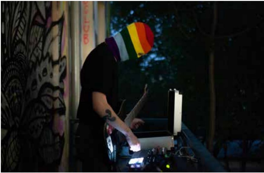
Vernisáž Rozptylu, hudobné vystúpenie KRN.

Vystavovali stredoškólači, deti, študenti vizuálneho umenia na vysokých školách, študenti iných umení či ich teórie, neškolení tvorcovia, najmladší aj najstarší, všetci na roveň postavení, s rovnakými pravidlami (nezasahujte do podlahy, neprebúrajte steny), ktoré zvädzali k porušeniu.