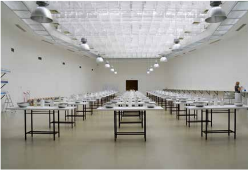
Pohľad do výstavy Ilona Németh: Eastern Sugar, 2018