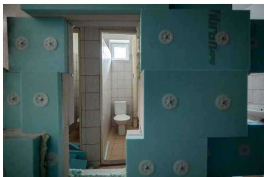
Dionýz Troskó a Filip Sabol: Lessons of No Existence , 2023.

sprejované prvky konštrukcie obrazu ležali použité na podlahe. Jednoduché a úderné (až na plexus solaris).