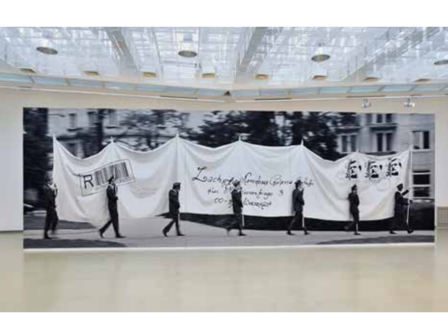
Goshka Macuga: Happening Tadeusza Kantora z roku 1967, 2011, vystavené v rámci výstavy Umenie na hlave (Poľské súčasné umenie) v roku 2015